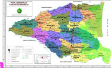
Gambar 2 Peta Adminitirasi Kabupaten Sidoarjo

Kabupaten Sidoarjo terletak di Jawa Timur dengan memiliki identitas daerah yang memiliki suatu perkembangan signifikan. Segala perkembangan yang pesat dilatarbelaknagi dari adanya kesuksesan dari segala potensi yang dimiliki. Hal ini menjadikan kemampuan daerah itu untuk menjadi letak yang strategis dalam perekonomian local. Diketa[3]h dara adanya suatu data bahwasannya letaknya ada diantara 112o5' dan 112o9' pada Bujur timur dan untuk 7p3 dan 7o5' ada pada bagian lintang selatan[5].