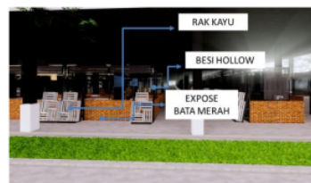
Gambar 8, Penerapan Material Modul Los

Untuk menggunakan warna secara monokrom ini agar dapat mmapu mmebrikan ruangan interior yang ada terkesan lebih nyaman dna harmonis selain itu secara langsung daoat menjadikan focus tersendiri terhdap suatu cokal point didalam bangunan interior yang aakan diterapkn setiap kios kios yang digunakan oleh penjual.