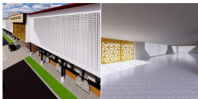
Gambar 9, Impelmentasi dengan warna Monokromatik

Selain fungsi vegetasi yang digunakan untuk sirkulasi udara, vegatsi ini akan digunakan untuk mendapatkan kesan yang lebih maksimal secara alami terhadap pandangan bangunan sendiri. Selain itu untuk adanya vegetasi ini tidka hanya diterpakan pada eksterior bangunan namun juga akan diterapkan pada interior bangunan segingga pembeli tidka akan merasa seperti terkurung dalam ruangan yang terlihat seperti vakum. Hal ini sudah dapat disimpulakjn bahwa bangunan arsitektural industrial ini mampu secara jujur tampil dengan menerapkan keadaan asli dari material sendiri.