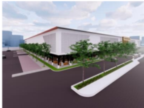
Gambar 8 implemnetasi dalam bangunan dengan merenaokan vegetasi didalamnya.

Dalam bangunan nanti akan memperlihatkan struktur bangunan secara langsung agar dapat mampu memiliki suasana yang akan lebih terkesan belum adanya pemenuhan dalam persiapan. Dengan sengaja material tidak akan dilakukan cat ulang namun akan menggunakan warna asli dari material itu hanya kan dilindungi dengan coating. Sehingga hal ini akan lebih memeplihatkan bangunan yang mengangkat tema industrial.