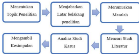
Gambar 1 Diagram metode penelitian

Untuk dapat menerapkkn konsep Arsitektur Industrial didalam pasar Tradisional yang ada di Kecamatan Taman akan menggunakan suatu penelitian dengan cara deskriptif kualitatif pada setiap analisis hingga hasil dalam penelitian pembahasan nanti.