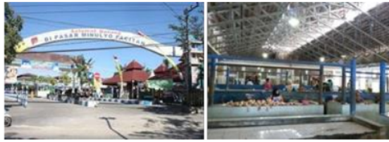
Gambar 6 Pasar Minulyo Pacitan

modern- tradisional sehingga terlihat secara langsung dari desain yang ada. Selain itu pasar ini juga memiliki kelebihan yang banyak selain adanya segala kebutuhan yang dibutuhkan mulai dari makanan, barang atau pun jasa pasar ini juga memiliki fasilitas pendukung didalamnya.