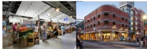
Gambar 5. Eksterior maupun Interior Boston Public

Adanya suatu bangunan yang menggunakan konsep bangunan industry terdapat pada bangunan Boston Public Market yang dimana bangunan ini terletak di amerika. Sebelum itu bangunan ini adalah salah satu pabrik yang dimana sekarang sudah menjadi pasar tradisional, tak hanya itu dalam pengalihan fungsi dari pabrik ke pasar tradisional ini masih terlihat bahwasannya adanya suatu nilai didalam bangunan dalam penggunaan konsep arsitektur industrial yang secara langsung terlihat didalam ruangan interior pasar ini.