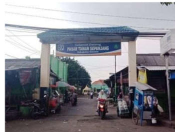
Gambar 3 Gerbang Utama Pasar Tradisional Sepanjang

Pasar ini telah mampu melakukan perkembangan hingga mmapu menerpkan pembangunan dengan adanya suatu kiosm, gerai dan juga adanya penerapan perbedaan tempat dalam aktivital PKL, hal ini dilakukan tepat pada tahun 1980 dimana dibangun di suatu lokaso yang memiliki luasan yang sangat banyak.