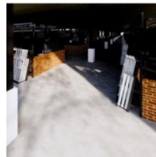
Gambar 7 Impelmentasi Material Gambar 7 Expose terhadap semen coating di Lantai Massa Utama

Hal ini sengaja dilakukan agar dimana dapat memberikan kenyamanan dalam pengunjung , pedagang maupun bangunan. Konsep pembanguna pasar tradisional yang akan dilakukan menggunakan konsep Arsitektur Industrial dianggap secara langsung mampu emmebrikan nilai secara kesederhaan dengan lebih dapat mengacu pemikiran untuk memicu minat pengunjung dengan tampilan yang sederhana. Material akan dapat memicu bagaimana nantinya tanpa adanya proses finishing material mabu memebrikan kesan yang cukup bagi bangunan selain untuk emminimalisir biaya perawatan diharapkan bisa menjadi unsur penting dalam bangunan. Diamna nanti akan menggunakan suatu warna secara monokrom agar terlihat lebih nyaman dan tidak bosan didalam bangunan interior tersebut. Penerapan ini dapat terlihat dari gambar berikut ini.