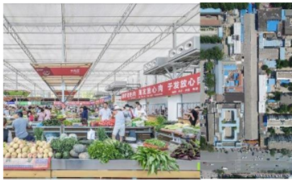
Gambar 4. Interior dan Layout Shengli Market

Shengli Market adalah julukan bagi pasar tradisional yang ada di china dimana dalam pasar ini menggunakan suatu adanya konsep dengan bukaan tanpa adanya suatu pemisahan antara penjual satu dengan penjual lainnya. Sehingga para pembeli yang ada dalam area ini secara langsung dapat melihat dengan open-view dari dalam maupun dari luar bangunan.