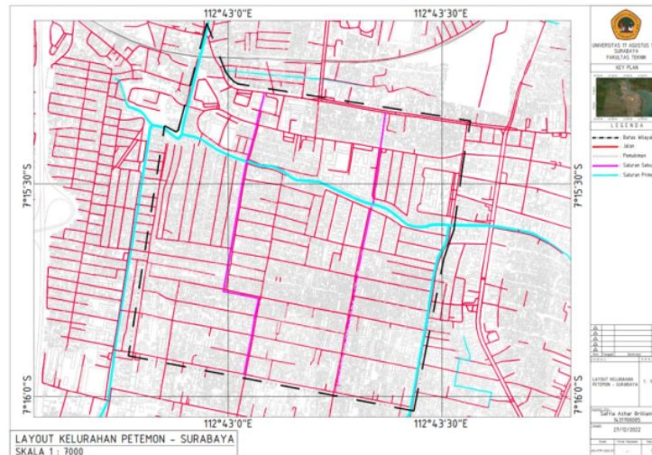
Gambar 2. Peta Lokasi Penelitian Sumber: Dokumentasi Pribadi, (2022)