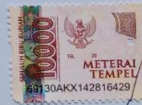
Vina Qurroti Ainun

Surabaya, ...1 Desember 2022 Yang membuat pernyataan