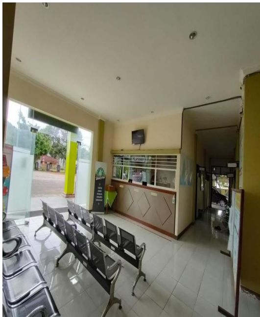
Ruang tunggu pelayanan Kantor Kecamatan Karang