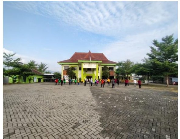
Kantor Kecamatan Karang