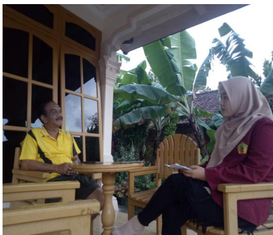
Wawancara dengan Bapak Nur Kadis Selaku Masyarakat