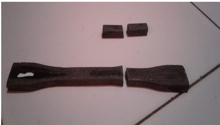
Gambar Hasil setelah pengujian tarik dan impak