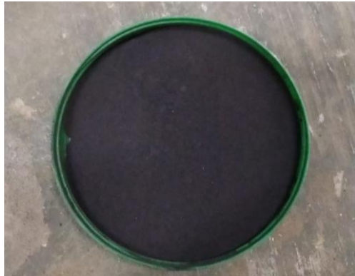
Gambar Bahan dasar plastik polipropilena dan abu dasar batubara