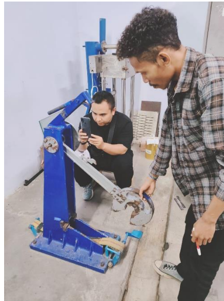
Gambar saat pengujian impact