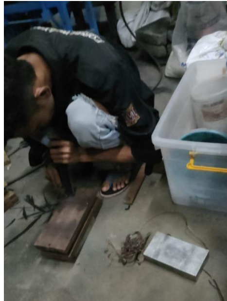
Gambar proses pada saat mencetak