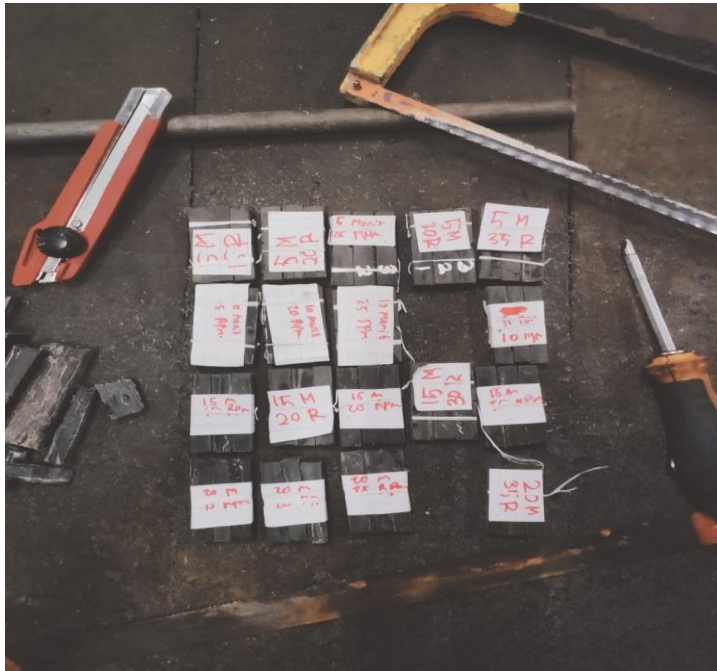
Gambar sampel uji impak yang sudah dirapikan