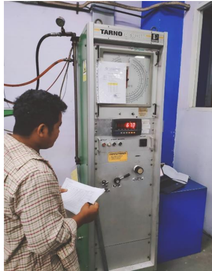
Gambar saat pengujian tarik