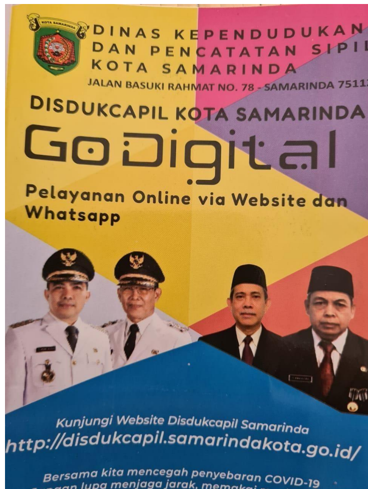
Lampiran 1. 1 Brosur pelayanan online pada Disdukcapil Kota Samarinda