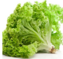
Gambar 2. 3 Selada

adalah vitamin A, B serta vitamin C. Terdapat beberapa jenis tanaman selada yang cukup sering ditanam yaitu selada mentega, selada tutup serta selada potong. Contoh tanaman selada yang populer dibudayakan dapat diketahui pada gambar 2.3