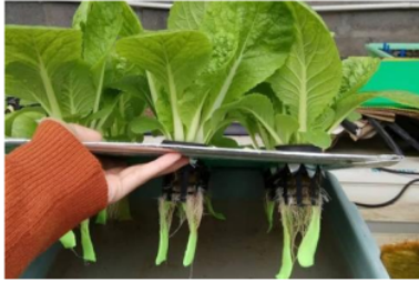
Gambar.2. 1 Hidroponik

Gambar 2.1, adalah sistem hidroponik yang telah berjalan dan sangat mudah dalam penerapan di petani maupun masyarakat.