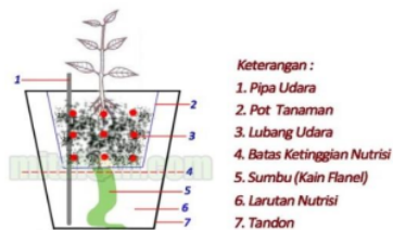
Gambar 2. 2 Hidroponik Wick

Sistem Hidroponik Teknik Terapung adalah pilihan yang bagus untuk pemula, karena mudah digunakan dan biasanya tersedia. Hidroponik mempunyai sistem standar disebabkan tidak adanya bagian yang bergerak di hidroponik, dan menggunakan sumbu, biasanya terbuat dari kain flanel, nutrisi dalam pengaliran air ke media tumbuh dari dalam wadah. Hal tersebut tertera pada gambar 2.2