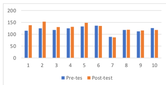
Gambar 1. Grafik Pre-test dan Post-test Skala Self Acceptance

Berdasarkan tabel 3, dapat diketahui bahwa subjek penelitian terdiri dari 10 orang dewasa awal yang terbagi menjadi 5 orang kelompok eksperimen dan 5 orang kelompok kontrol. Jika dilihat dari perbedaan skor pre-test dan post-test , terjadi peningkatan pada semua subjek eksperimen. Sedangkan pada kelompok kontrol, terjadi peningkatan skor sebanyak 2 orang dan penurunan skor sebanyak 3 orang.