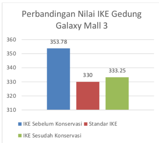
Gambar 4. 1 Grafik perbandingan IKE Galaxy Mall 3