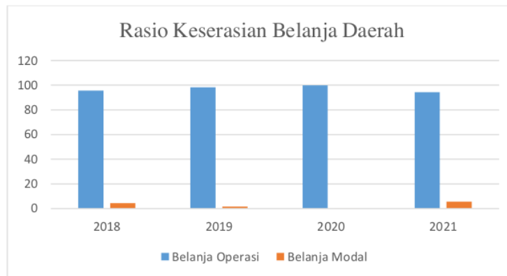
Gambar 3. Rasio Keserasian Belanja Daerah 2018-2021

Berdasarkan hasil analisis diatas menunjukkan bahwa Kecamatan Klampis, Kabupaten Bangkalan Tahun Anggaran 2018-2021 rasio belanja modal lebih kecil dibandingkan rasio belanja operasi karena dana dari jumlah belanja daerah lebih