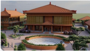
Gambar 8. Suasana Sumber( Analisis Penulis 2022)