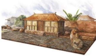
Gambar 2. Transformasi Bentuk Bangunan