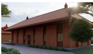
Gambar 4 bentuk bangunan

B. Hubungan Abstrak sebagai konteks terhadap bentuk bangunan. Bentuk bangunan mengambil bentukan rumah kawula majapahit, dengan mengambil unsur batubata ekspose dan elemen kayu pada bangunan.