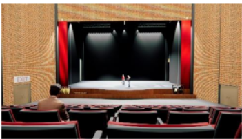
Gambar 9. Suasana