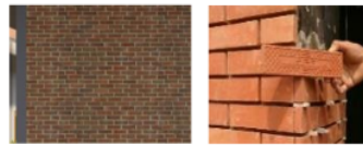
Gambar 6. Material

D. Hubungan kontemporer dan hubungan masadepan sebagai konteks terhadap bahan bangunan dan strukur bangunan.