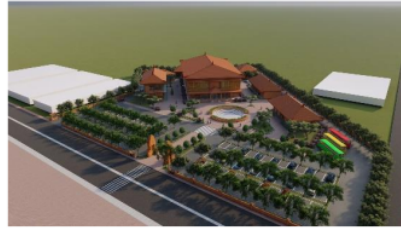
Gambar 5 Suasana

C. Hubungan lansekap sebagai konteks terhadap suasana bangunan.