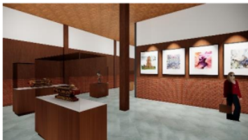
Gambar10. Suasana Sumber( Analisis Penulis)