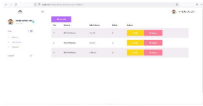
Gambar 3.2 Halaman Sub Kriteria

serta bobot yang ditampilkan dalam halaman kriteria.