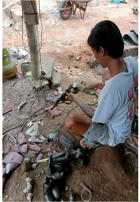
Dokumentasi Peneliti Kunjungan wisatawan Asing ke Kampung Majapahit