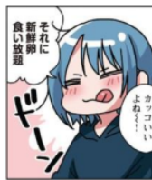
Gambar 12 Giyougo “ドーン”

Pada gambar di atas terlihat Emu yang sedang berbicara sambil membayangkan makanan yang ingin ia makan. Keadaan Emu ini dilambangkan dengan kata “ドーン”. Kata “ドーン” adalah onomatope jenis giyougo karena melambangkan keadaan dan tingkah laku dari makhluk hidup. Maksudnya adalah keadaan seseorang sedang membayangkan sesuatu.