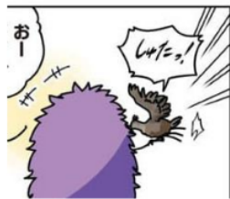
Gambar 16. Giyougo “しゅたっ”

Pada gambar di atas terlihat seekor burung yang hinggap di tangan papiru. Keadaan burung ini dilambangkan