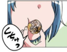
Gambar 22. Giyougo “ゴグ”

Pada gambar di atas terlihat Emu yang memakan sebuah embrio ayam yang telah dikupasnya pada halaman 10. Emu memasukkan makanan tersebut ke dalam mulutnya, keadaan Emu ini dilambangkan dengan kata “しちゅっ”. Kata “しちゅっ” adalah onomatope jenis giyougo karena melambangkan keadaan dan tingkah laku dari makhluk hidup. Maknanya adalah Melambangkan keadaan seseorang yang akan memakan sesuatu.