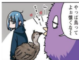
Gambar 9. Giseigo “ちゅっちゅ”

Pada gambar di atas terlihat papiru sedang mencium burung yang ada di panel 4 chapter 20. Suara papiru mencium burung ini dilambangkan