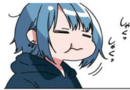
Gambar 10. Giseigo “しゃくっ”

Pada gambar di samping terlihat Emu sedang memakan embrio ayam yang sudah di rebus pada panel 10. Suara Emu yang sedang mengunyah ini dilambangkan dengan kata “しゃくっ”. Kata “しゃくっ” ini merupakan onomatope jenis giseigo karena menirukan suara yang ditimbulkan oleh makhluk hidup. Maknanya adalah suara seseorang sedang mengunyah.