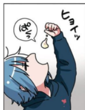
Gambar 23. Giyougo “ヒョイツ”

Pada gambar di samping terlihat Emu memasukkan makanan ke dalam mulutnya.