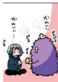
Gambar 35. Gijougo “かわいい”

Pada gambar di samping terlihat Emu dan Papiru yang sedang bermain dengan anak ayam yang