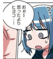
Gambar 21. Giyogo “ゴク”

Pada gambar di atas terlihat Emu yang selesai mengupas kulit telur dan memegang embrio ayam. Kemudian Emu berbicara dari dalam hatinya tentang embrio ayam tersebut. Aktivitas Emu ini dilambangkan dengan kata “ゴク”. Kata “ゴク” adalah onomatope jenis giyogo karena melambangkan keadaan dan tingkah laku dari makhluk hidup. Maknanya adalah keadaan seseorang yang berbicara dari dalam hati.