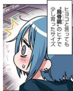
Gambar 31. Gijougo “キューン”

Pada gambar di samping terlihat Emu sedang terpikat