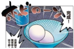
Gambar 27. Gitaigo “ホピローン”

Pada gambar di atas terlihat telur yang sudah direbus sebelumnya oleh Emu pada panel 9 chapter 2. Kata “ホピローン” ini menyatakan nama makanan dari telur yang diolah oleh Emu sebelumnya. Kata “ホピローン” ini adalah onomatope jenis gitaigo karena menyatakan keadaan dari benda mati.. Maknanya adalah menyatakan nama makanan yang telah diolah.