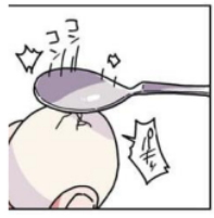
Gambar 28. Gitaigo “パキッ”

Pada gambar di atas terlihat Emu sedang memecahkan telur yang sudah direbusnya pada chapter 20 halaman 9 menggunakan sebuah sendok. Ketukan dari sendok ini membuat kulit telur tersebut sedikit retak. Keadaan dari telur ini dilambangkan dengan kata “パキッ”. Kata “パキッ” adalah onomatope jenis gitaigo karena menyatakan keadaan dari benda mati.. Maknanya adalah menyatakan keadaan cangkang telur yang pecah.