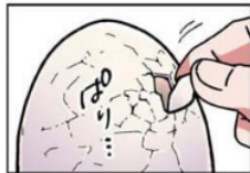
Gambar 19. Giyogo “はり”

Pada gambar di atas terlihat Emu sedang memecahkan telur yang sudah direbusnya pada chapter 20 halaman 9. Aktivitas Emu mengupas kulit telur ini dilambangkan dengan kata “はり”. Kata “はり” adalah onomatope jenis giyogo karena melambangkan keadaan dan tingkah laku dari makhluk hidup. Maknanya adalah keadaan seseorang mengupas kulit telur