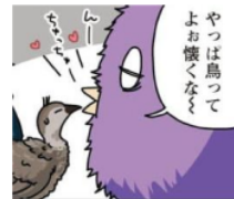
Gambar 32. Gijougo “んー”