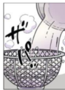
Gambar 4. Giongo “ザパッ”

Pada gambar di samping terlihat ari mendidih dituangkan ke alat penyaringan.