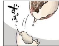
Gambar 6. Giongo “ずぼっ”

Pada gambar di atas terlihat isi dari telur yang dipecahkan terlepas dari sisa cangkangnya dan menimbulkan suara. Suara isi telur yang terlepas dari cangkangnya ini dilambangkan dengan kata “ずぼっ”. Kata “ずぼっ” adalah onomatope jenis giongo karena menirukan suara dari benda mati. Maknanya adalah suara cangkang telur yang terlepas.