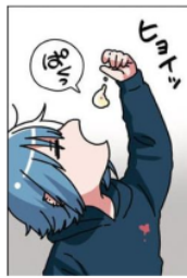
Gambar 29. Gitaigo “ばくっ”

Pada gambar di samping terlihat Emu memakan sisa dari embrio ayam yang telah ia masak sebelumnya.