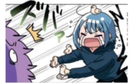
Gambar 26. Giyougo “ズバァ”

Pada gambar di atas terlihat Emu yang tiba-tiba berbicara sambil menangis ke Papiru, Papiru yang terkejut karena tingkah Emu ini dilambangkan dengan kata “ズバァ”. Kata “ズバァ” adalah onomatope jenis giyougo karena melambangkan keadaan dan tingkah laku dari makhluk hidup. Maknanya adalah keadaan seseorang yang terkejut.