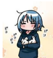
Gambar 7. Giseigo “ビョ”

Pada gambar di atas terlihat Emu sedang membawa dua ekor anak ayam. Suara dari anak ayam ini dilambangkan dengan kata “ビョ”. Kata “ビョ” adalah onomatope jenis giseigo karena