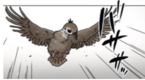
Gambar 8. Giseigo “バササッ”

Pada gambar di atas terlihat seekor burung yang sedang terbang dan hinggap di tangan Papiru. Suara dari kepakkan sayap burung ini dilambangkan dengan kata “バササッ”. Kata “バササッ” ini merupakan onomatope jenis giseigo karena menirukan suara yang ditimbulkan oleh makhluk hidup. Maknanya adalah suara kepakkan sayap burung.