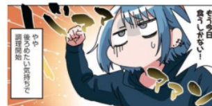
Gambar 18. Giyougo “バママン”

Pada gambar di atas terlihat Emu yang memutuskan untuk memakan telur yang dipegangnya. Keadaan Emu ini