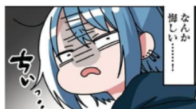
Gambar 33. Gijougo “ちいっ”

Pada gambar di atas terlihat Emu merasa jijik karena melihat Papiru yang mencium seekor burung. Keadaan Emu yang merasa jijik ini dilambangkan dengan kata “ちいっ”. Kata “ちいっ” ini adalah onomatope jenis gijougo karena melambangkan perasaan atau suasana hati manusia. Maknanya adalah seseorang merasa jijik.