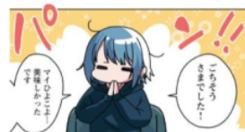
Gambar 25. Giyougo “パン”

Pada gambar di atas terlihat Emu yang selesai menikmati makanannya yaitu embrio ayam yang ada pada panel 11