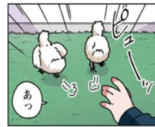
Gambar 17. Giyougo “ピューッ”

Pada gambar di atas terlihat anak ayam yang berlari menjauhi Emu. Keadaan anak ayam yang berlari ini dilambangkan dengan kata “ピューッ”. Kata “ピューッ” adalah onomatope jenis giyougo karena melambangkan keadaan dan tingkah laku dari makhluk hidup. Maknanya adalah anak ayam yang berlari.