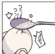
Gambar 5. Giongo “コンコン”

Pada gambar di atas terlihat telur yang sudah direbus sebelumnya. Telur tersebut dipecahkan menggunakan sendok, sendok yang mengetuk cangkang telur ini menghasilkan suara. Suara ini dilambangkan dengan kata “コンコン”. kata “コンコン” ini adalah onomatope jenis giongo karena menirukan suara dari benda mati yaitu sendok. Maknanya adalah suara ketukan sendok.