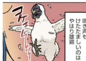
Gambar 11. Giseigo “コケエ”