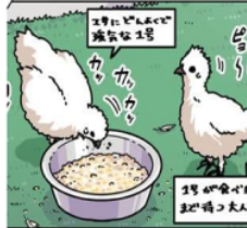
Gambar 15. Giyougo “カッカッ”

Pada gambar di atas terlihat anak ayam yang sedang makan. Keadaan anak ayam yang sedang makan ini dilambangkan dengan kata “カッカッ”. Kata “カッカ” adalah onomatope jenis giyougo karena melambangkan keadaan dan tingkah laku dari makhluk hidup. Maknanya adalah keadaan anak ayam yang sedang makan