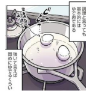
Gambar 3. Giongo "ぐっぐっ"

Pada gambar di atas terlihat telur yang sedang direbus di dalam panci berisi air yang mendidih. Air yang mendidih ini menimbulkan suara dan dilambangkan dengan kata "ぐっぐっ". Kata "ぐっぐっ" ini adalah onomatope jenis giongo karena menirukan suara dari benda mati. Maknanya adalah suara air yang mendidih.