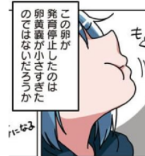
Gambar 24. Giyougo “もぐ”

Pada gambar di atas terlihat Emu sedang mengunyah makanan yang direbus sebelumnya pada panel 9 chapter 20. Keadaan Emu yang sedang mengunyah ini dilambangkan dengan kata “もぐ”. Kata “もぐ” adalah onomatope jenis giyougo karena melambangkan keadaan dan tingkah laku dari makhluk hidup. Maknanya adalah keadaan seseorang sedang mengunyah.