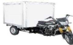
Gambar 3. Tossa Viar Box

Untuk rencana investasi yang akan dilakukan adalah menggantikan armada lama Daihatsu Grandmax Minibus dengan Armada Baru Tossa Viar Box. Lebih jelasnya tentang armada baru tersebut dilihat pada tabel 14.