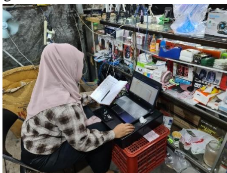
Figure 1 User menggunakan sistem