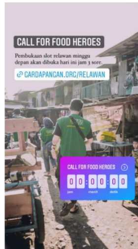
Gambar 2. Story Instagram Garda Pangan.

“... mungkin strategi komunikasi kita lewat Instagram udah cukup efektif yaa aku ga bilang sudah optimal tapi mungkin cukup efektif.” (Bachtiar E, 2022)