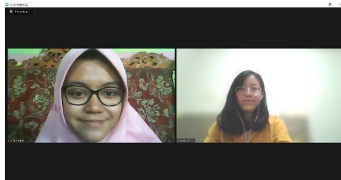
Wawancara dengan Informan Pendukung yaitu Followers Bright Soul