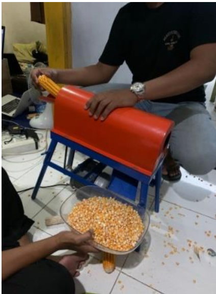
Proses pemipilan jagung dan keluarnya jagung