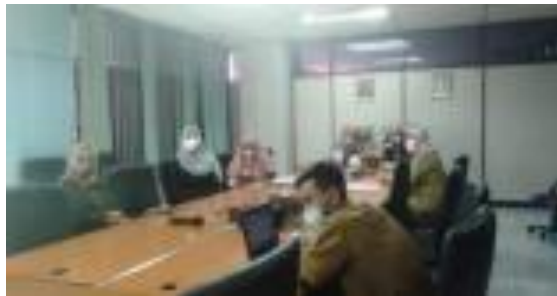
Foto Dokumentasi di Kelurahan Warakas