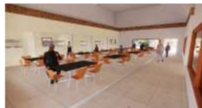
Gambar 13. Interior Restoran