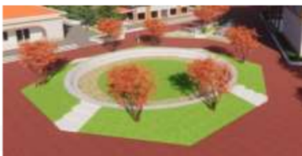
Gambar 11. Pelatihan Outdoor