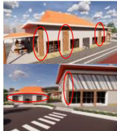
Gambar 8. Penerapan Material Lokal

Material dinding menggunakan material lokal yaitu batu bata merah. Dengan pemasangan yang sebagian terekspose hal ini menciptakan suasana tradisional yang disatukan dengan material modern.