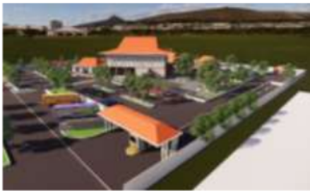
Gambar 9. Perspektif Mata Burung