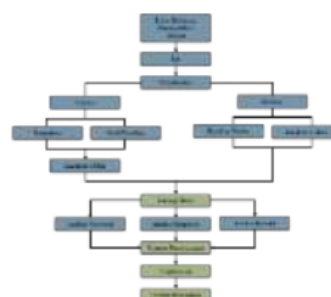
Bagan 1. Alur Pemikiran