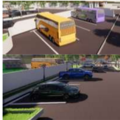
Gambar 14. Area Parkir