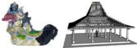
Gambar 5. Ide Bentuk

Ide bentuk merupakan hasil gabungan dari simbol Turonggo Yakso dan atap Joglo yang di terapkan pada massa utama