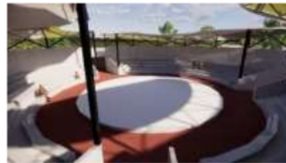
Gambar 12. Amphiteater