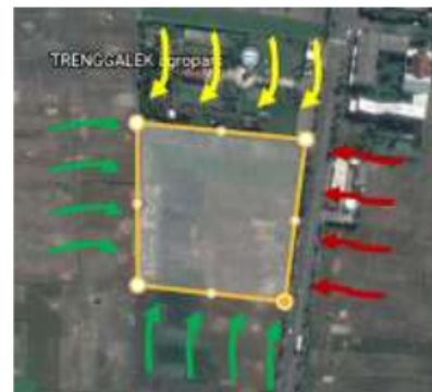
Gambar 2. Analisa Kebisingan Taak

Entrance nantinya akan diletakkan pada bagian lahan yang berhubungan langsung dengan jalan nasional, dan akses keluar masuk dibuat berlawanan untuk memudahkan pengguna keluar masuk saat terjadi hal yang tidak diinginkan.