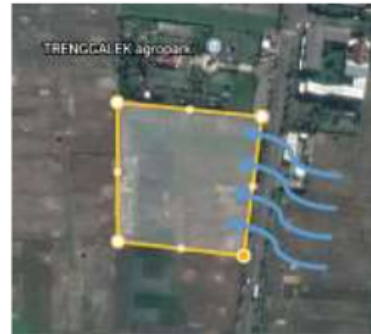
Gambar 4. Analisa Angin Tapak

ruang terbuka. Karena kondisi disekitar tapak berada dilahan yang cukup terbuka pada sisi barat, selatan, dan timur.