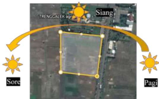
Gambar 3. Analisa Matahari Tapak

Tingkat kebisingan yang tinggi dihasilkan di sisi timur jalan Trenggalek 7 - Ponorogo, akibat aktivitas kendaraan roda dua dan roda empat yang sangat padat (garis merah). Kebisingan di sisi utara site lebih rendah dari pada sisi timur, yang disebabkan oleh banyak orang yang bergerak di sekitar Trenggalek Agropark (garis kuning). Tingkat kebisingan yang cukup tenang di sisi selatan dan barat site karena aktivitas yang lebih sedikit (garis hijau).