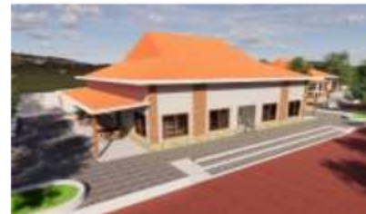
Gambar 13. Pusat Oleh – Oleh & Restoran