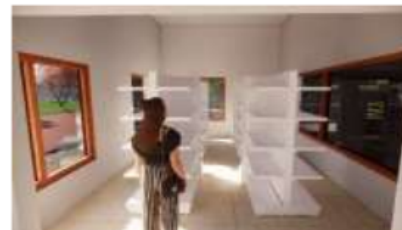
Gambar 14. Interior Toko Oleh Oleh