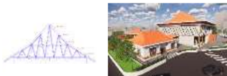
Gambar 7. Penerapan Atap Joglo

Bangunan ini memiliki atap joglo. Karena bentuknya menyerupai gunung. Bentuk gunung dipilih menurut kepercayaan tradisional Jawa, karena gunung merupakan simbol dari segala kesakralan