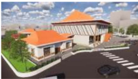
Gambar 10. Gedung Pertunjukan & Pelatihan