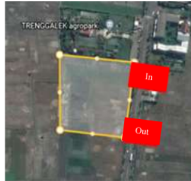
Gambar 1. Analisa Entrance Tapak

Entrance nantinya akan diletakkan pada bagian lahan yang berhubungan langsung dengan jalan nasional, dan akses keluar masuk dibuat berlawanan untuk memudahkan pengguna keluar masuk saat terjadi hal yang tidak diinginkan.