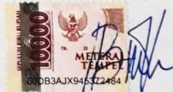
Bella Putri Cahyani Priyono