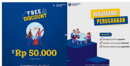
Gambar 2. Teknik Push Strategy

PT. Airlangga Global Traveling juga menerapkan push strategy untuk mendorong pembelian perusahaan melakukan strategi ini dengan cara memberikan banyak penawaran promo harga mulai tiket pesawat, kereta api, dan hotel. Selain itu, perusahaan juga membuka kerjasama perusahaan dengan manfaat mendapat fasilitas paylater , customer service yang responsif, dan batasan plafond yang negotiable.