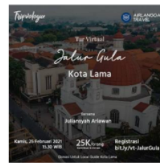
Gambar 3. Teknik Pass Strategy

PT. Airlangga Global Traveling juga menerapkan pass strategy untuk menciptakan opini publik yang menguntungkan. Dimana dalam hal ini bertujuan untuk mempengaruhi opini konsumen terhadap perusahaan. Taktik tersebut dijalankan oleh Airlangga Travel dalam bentuk melakukan kegiatan sosialisasi dan berpartisipasi dalam kegiatan kemasyarakatan dengan mensupport kendaraan berupa mobil dan hiace secara gratis ketika ada kegiatan pengajian di masjid Ulul Azmi Universitas Airlangga. Selain itu, ketika pandemi perusahaan melakukan kegiatan donasi kepada lokal guide di Kota Lama Semarang dengan mengadakan event Tour Virtual.