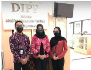
Gambar 5. Teknik Personal Selling

mengarahkan tim marketing dan tim tour & MICE untuk melakukan kunjungan ke instansi, lembaga, atau perusahaan untuk menjaga kualitas relasi dan tentunya menawarkan produk atau jasa perusahaan.