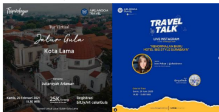
Gambar 1. Teknik Pull Strategy

PT. Airlangga Global Traveling mempraktikkan pull strategy kepada konsumen dan calon konsumen untuk menarik perhatian dengan cara membuat kegiatan yang belum pernah dilakukan oleh perusahaan travel lain di saat pandemi yaitu Tour Virtual di Jalan Gula Kota Lama Semarang melalui zoom yang diikuti oleh masyarakat umum, perusahaan berusaha mengajak masyarakat untuk melakukan perjalanan wisata yang dilakukan dari rumah, selain itu juga membuat kegiatan Travel Talk yaitu sharing session dengan pelaku usaha wisata dan perhotelan untuk membahas pariwisata di saat pandemi, dilakukan melalui live stream di instagram dan youtube.