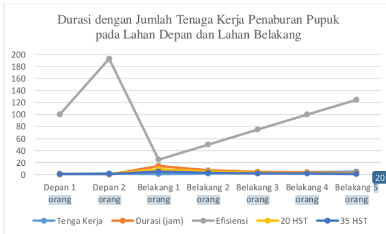
Gambar 1. Grafik perbandingan jumlah tenaga kerja dengan durasi

Perhitungan analisa data dengan dilakukan perbandingan antara tenaga kerja dengan durasi guna mengetahui tingkat efisiensi dan pengambilan kembali pupuk kedalam ember seperti pada Gambar 1.