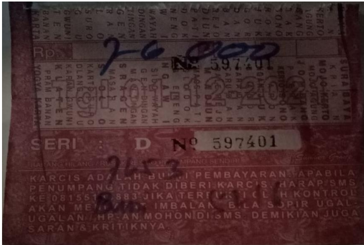
Gambar tiket bus Sumber Selamat