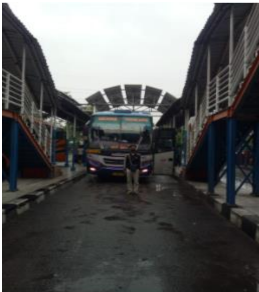
Gambar objek penelitian bus Sumber Selamat