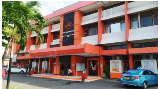
Halaman Depan Kantor Pos Indonesia Surabaya Selatan