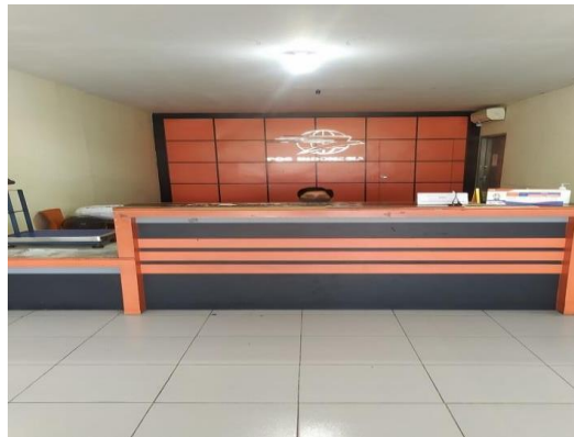
Loket paket dan logistic