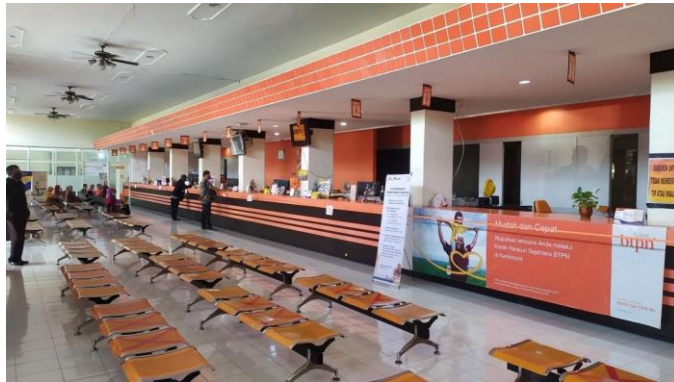
Loket pengiriman surat dan pelayanan jasa keuangan