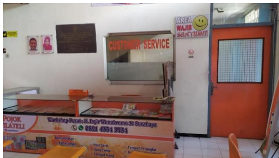
Kantor Humas dan Customer Service