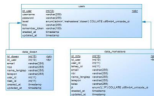
Gambar 2. Tabel Data Pengguna

Ketiga tabel pada Gambar 2, berfungsi untuk menampung data pengguna dengan perbedaan yang terletak pada level masing – masing pengguna yaitu dosen, admin, dan mahasiswa. Admin berperan sebagai coordinator TA, dosen berperan sebagai dosen pembimbing dan dosen penguji, dan mahasiswa berperan sebagai peserta.