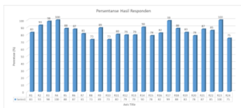
Gambar 9. Persentase Hasil Responden

Dengan instrumen pertanyaan yang telah diberikan diperoleh alpha sebesar 0,871 yang dapat dilihat pada Gambar 8. yang berarti instrumen pertanyaan yang digunakan termasuk kedalam kategori baik. Kesimpulan nya ialah sebanyak 22 pertanyaan dinyatakan valid dan reliabel. Dilanjutkan dengan analisis hasil penilaian tanggapan responden usabilitas dengan hasil pertanyaan yang valid sebanyak 22 yang dapat dilihat pada grafik persentase pada Gambar 9.