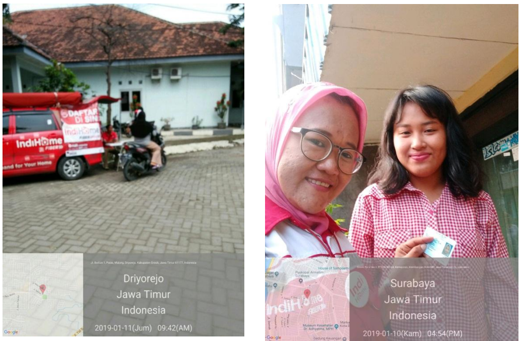
Gambar 9. Penjualan Personal Produk IndiHOME melalui Door To Door