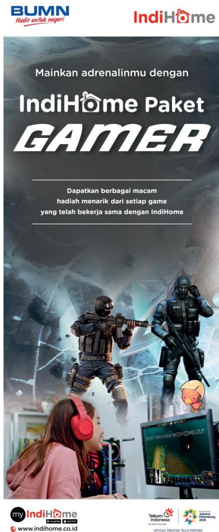
Gambar 7. Roll Banner dari Paket Promo IndiHOME