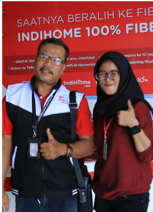
Gambar 4. Foto Bersama Ibu Ajeng selaku Sales Agency