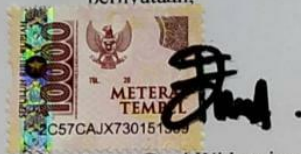
Fanny Devi Widyaningrum

Surabaya, Januari 2022 Yang membuat pernyataan.