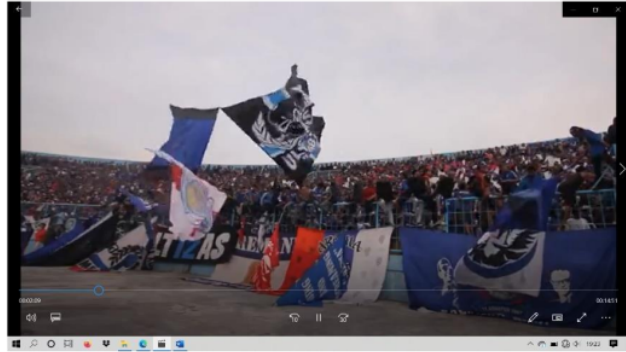
Gambar 2. Scene Pengibaran Bendera