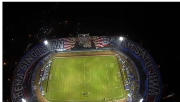
Gambar 3. Scene pembentangan bendera raksasa oleh aremania

Menurut (Dirlanudin, 2018) terdapat ciri-ciri individu kreatif yang ditunjukkan oleh aremania dalam scene diatas, yaitu memiliki kemampuan untuk bermain dengan ide atau konsep. . Dalam membuat sebuah bendera atau giant flag aremania memiliki beragam ide dan konsep. Jika dilihat pada scene kedua, bendera atau giant flag yang dikibarkan oleh beberapa aremania memiliki motif yang berbeda-beda. Aremania memiliki kemampuan untuk menuangkan ide dan konsepnya di media bendera atau giant flag sehingga memiliki motif dan konsep yang berbeda dan beragam.