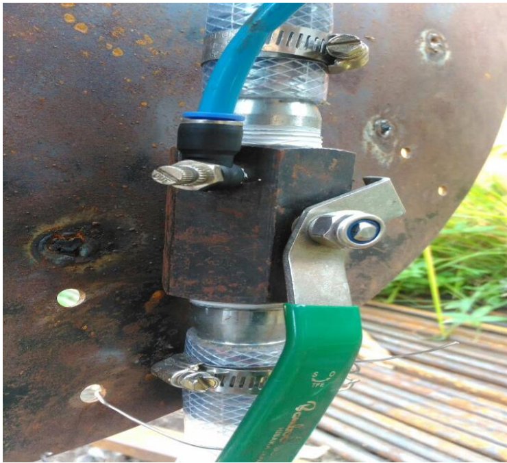
Stop Kran Dan Alat Injeksi Udara Pada Pompa Hydrum Spiral