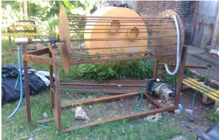
Pandangan Depan Pompa Hydram Spiral