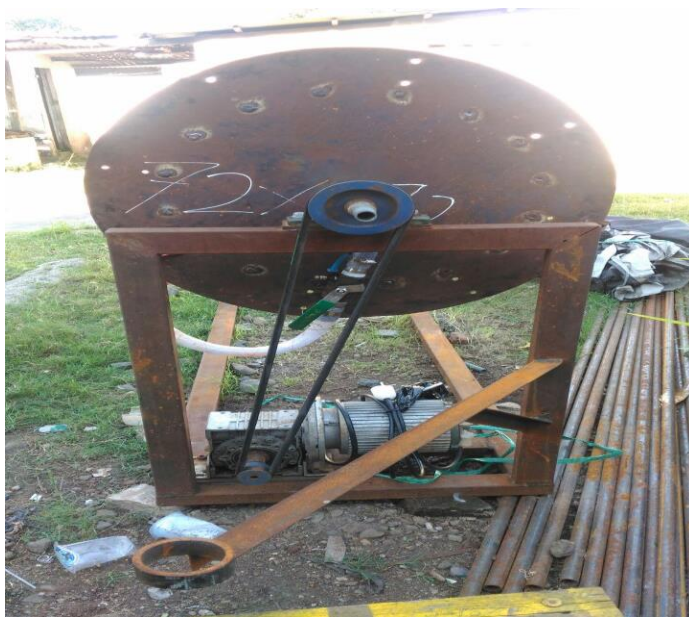
Pandangan Samping Pompa Hydram Spiral