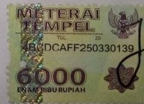
Dwi Oktavia Setiawati