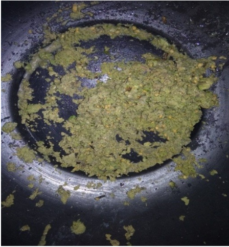
Hasil proses cukup maksimal