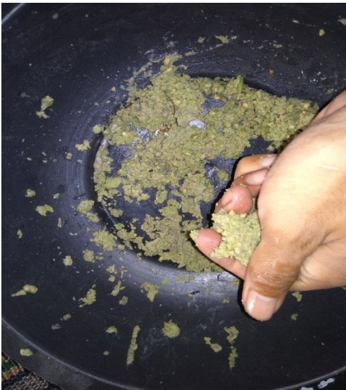
Hasil proses kurang maksimal