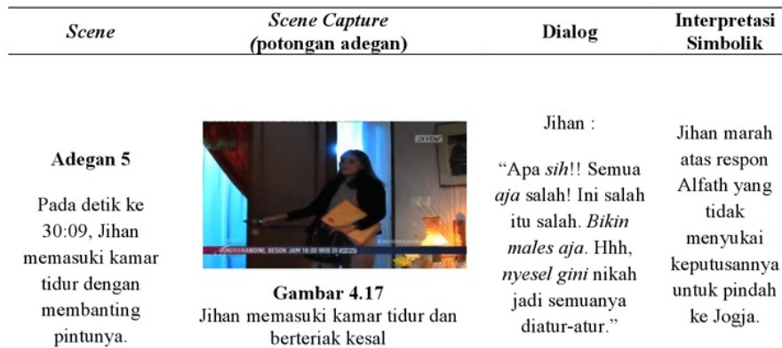
Tabel 1 Posisi subjek pada sinetron "Jodoh Wasiat Bapak" episode 447

pernikahan yang mengharuskan melakukan peran domestik. Berikut teks yang ditemukan dalam adegan sinetron "Jodoh Wasiat Bapak" episode 447 dengan posisi subjek-objek dan pembaca.