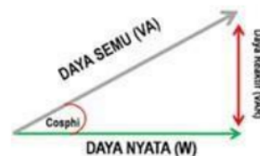
Gambar 2.1 Segitiga Daya