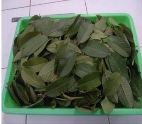
Daun jambu biji