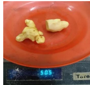
Menimbang jahe 50 gr