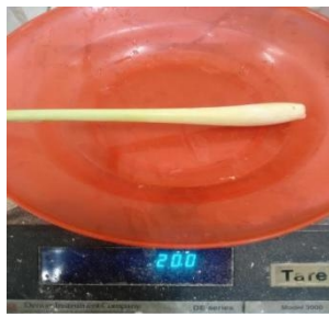
Menimbang serai 20 gr