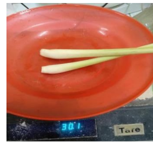
Menimbang serai 30 gr