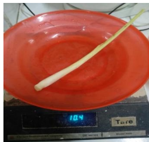
Menimbang serai 10 gr