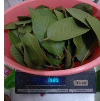
Menimbang daun jambu biji 150 gr