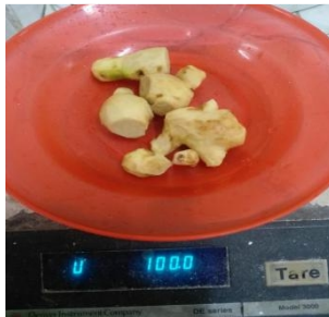
Menimbang jahe 100 gr