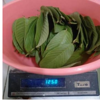
Menimbang daun jambu biji 125 gr