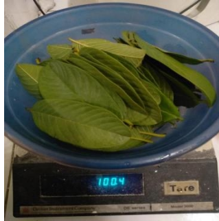
Menimbang daun jambu biji 100 gr