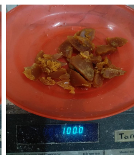
Menimbang gula merah 100 gr