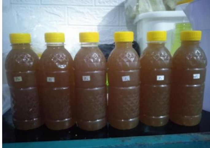
Hasil produk minuman fungsional