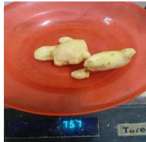
Menimbang jahe 75 gr