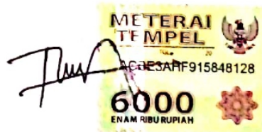
Tira Yuli Prasasti