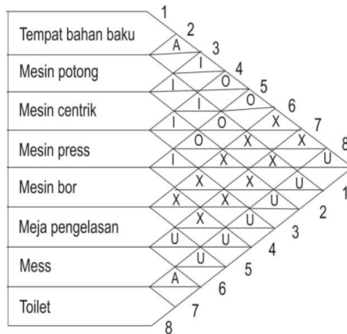
Gambar 1 Derajat hubungan tiap departemen