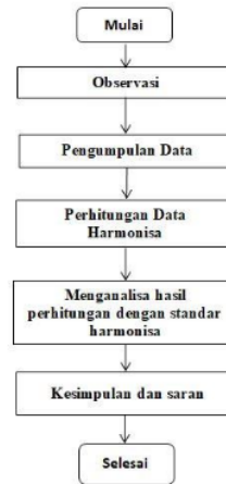
gambar 1 flowchart penelitian