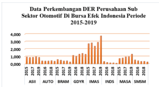
Gambar 1. Perkembangan Struktur Modal (DER) Sub Sektor Otomotif Di Bursa Efek Indonesia Periode 2015-2019

Begitu pula yang ditemukan sepanjang tahun 2015-2019 perusahaan manufaktur sub sektor otomotif kebanyakan mengalami kenaikan pada Dept Equity Ratio yang melibatkan 8 emiten. Yang mana data yang dimaksud sebagai berikut :