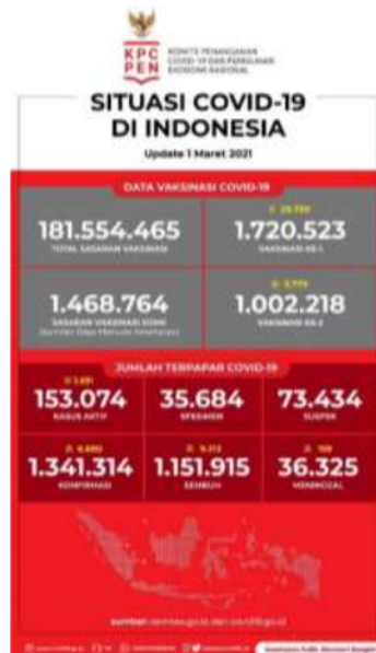
Gambar 1. Angka Sebaran COVID-19 Indonesia

17 3 World Health Organization (WHO) Maret 2020, menyatakan Corona Virus Disease atau COVID-19 menjadi pandemi di seluruh dunia. Gejala COVID-19 antara lain; demam, batuk, sesak 17 pas, diare, sakit tenggorokan, kehilangan indra rasa, dan ruam kulit (WHO-Indonesia, 2020). Pandemi COVID-19 di Indonesia belum kunjung mereda, hingga 1 Maret 2021 terdapat 6680 penambahan kasus baru dengan total sebanyak 1.341.314 pasien terkonfirmasi COVID-19, pasien sembuh sebanyak 1.151.915 dan dinyatakan meninggal sebanyak 36.325 pasien.