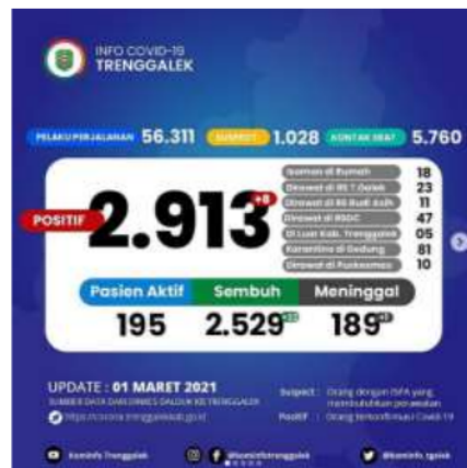
Gambar 2. Angka Sebaran COVID-19 Trenggalek

penurunan tenaga kerja, melonjaknya harga kebutuhan pokok, dan menurunnya penjualan produk UKM masyarakat Trenggalek juga ikut terdampak.