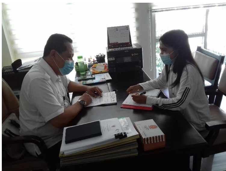
Hasil wawancara dengan kepala bidang penelitian dan pengembangan