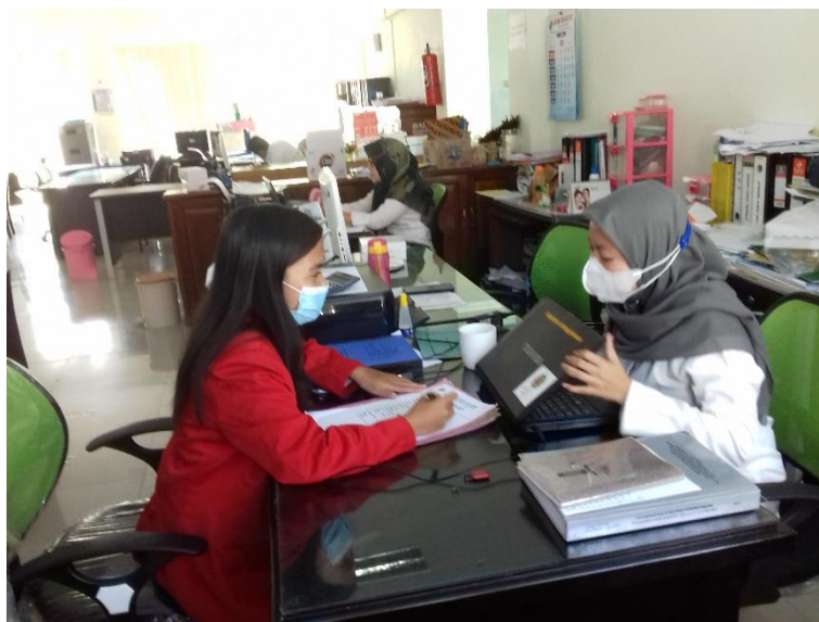
Hasil wawancara dengan staf bidang litbang