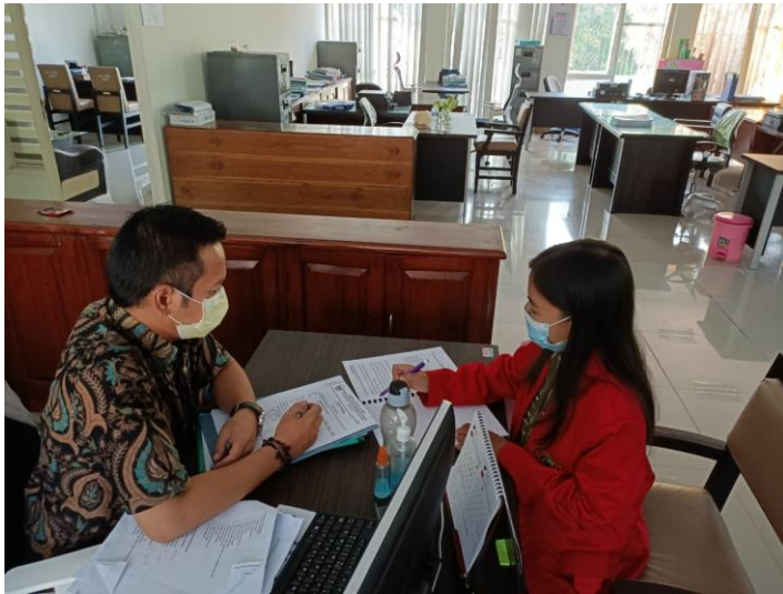
Hasil wawancara dengan kepala sub bidang inovasi dan teknologi