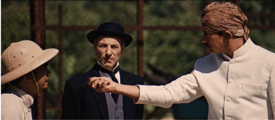
Gambar 6.2 Tjokroaminoto Dengan Tuan Rinkes Sedang Mengunjungi Anggota Organisasi Sarekat Islam (Si) Di Surabaya

Gambar diatas menunjukkan Reperesentasi nasionalisme dengan sosok Tjokroaminoto berusaha untuk melakukan yang terbaik untuk rakyatnya yaitu dengan memberikan saran agar membuat koperasi yang mana menurutnya koperasi adalah salah satu wadah yang terpenting untuk mensejahterakan rakyatnya dibawah pimpinan organisasi yang dipimpinnya yaitu Sarekat Islam. Tjokro lakukan untuk rakyatnya. Ia mempunyai inisiatif tersendiri untuk memajukan rakyat nusantara agar terlepas dari genggaman penjajah. Walaupun bentuk perubahannya tidak terlalu signifikan, tetapi ia sudah berusaha semampu yang ia bisa, melakukan perubahan demi kemajuan bangsa dan negaranya. Hal ini pula yang menggambarkan rasa nasionalismenya yang kuat dalam dirinya terhadap seluruh rakyatnya. Tindakan yang dilakukan 4 Tjokro yang tergambar diatas adalah salah satu bentuk profesionalitas dari sosok Tjokro yang ia lakukan yaitu untuk mensejahterakan rakyatnya, yang mana ia harus memegang teguh amanat yang diberikan kepadanya oleh seluruh rakyatnya khususnya di tanah jawa, karena seyogyanya kesejahteraan rakyat adalah tanggung jawab seorang pemimpin.