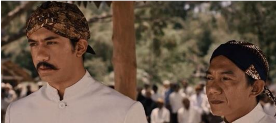
Gambar 5.1 Tjokroaminoto Sedang Berpidato Di Depan Anggota Sarekat Islam Didampingi Oleh Saman Hoedi.

Gambar diatas menunjukkan Reperesentasi Nasionalisme dengan sosok Tjokroaminoto berpidato di hadapan ribuan masyarakat yang hadir, untuk mengajak seluruh rakyatnya agar tidak diam dalam setiap penindasan yang dilakukan oleh penjajah. Ia menyarankan untuk sama-sama melakukan perlawanan, karena selama ini belanda sudah menginjak-injakkan harga diri rakyat nusantara khususnya rakyat jawa, yang sudah menjadikan rakyatnya sebagai “sapi perah” bagi keuntungan Belanda karena politik etisnya. Dengan begitu mereka bisa ikut berpartisipasi dalam suatu kegiatan yang berguna untuk memajukan bangsa dan negaranya tercinta. Hal ini juga menandakan bahwa Tjokro mencoba untuk menjaga dan melindungi negara dari segala bentuk ancaman, baik dari dalam maupun luar, serta ia sudah ikut berpartisipasi dalam suatu kegiatan yang berguna untuk memajukan bangsa dan negaranya.